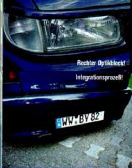
Rechter Optikkblock! Integrationsprozeß!