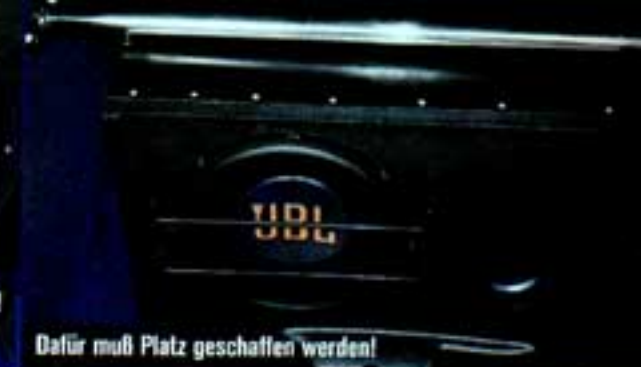
Dafür muß Platz geschaffen werden!