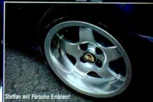
Steffan mit Porsche Emblem!