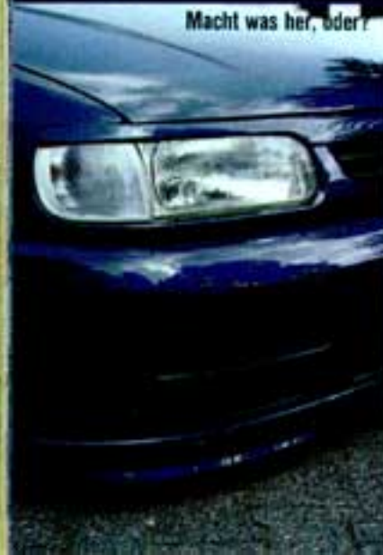
Macht was her, oder?