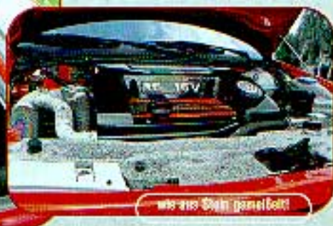
wie aus Stein gemacht!