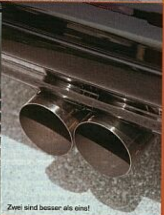
Zwei sind besser als eins!

quelle dient der 3,0 l Reihensechser und leistet mit einigen Modifikationen 210 PS. Für einen Gleiter wie den SL sicherlich eine angemessene Motorisierung. Die Abgasentsorgung des Motors übernimmt eine Edelstahl-auspuffanlage mit zwei je 100 mm Endrohren, die sich trotz der Größe noch relativ dezent in die Heckansicht integrieren.